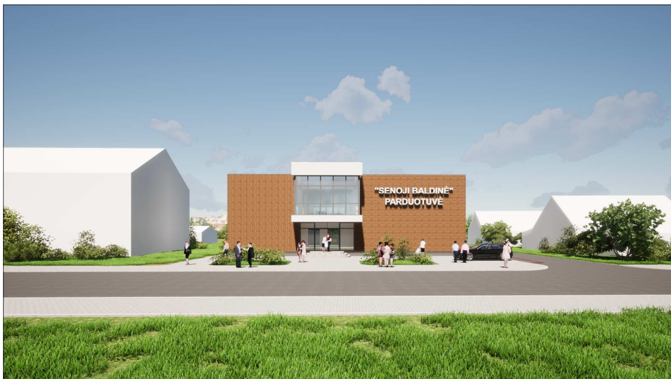
Fasadas tarp ašių 1-6. Vaizdas nuo šiaurės vakarų pusės (Klaipėdos gatvės)