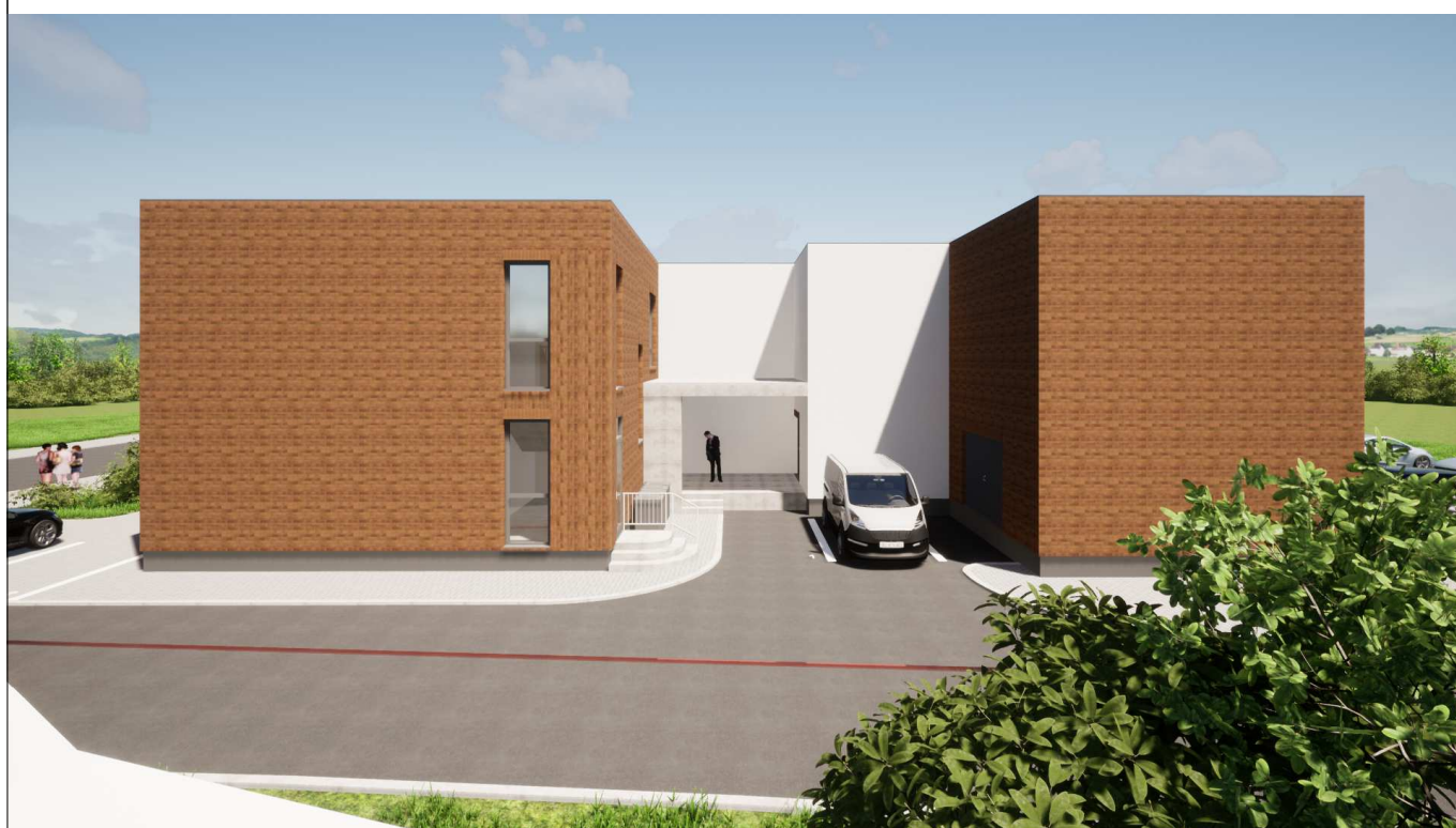
Fasadas tarp ašių G-A. Vaizdas nuo pietryčių pusės