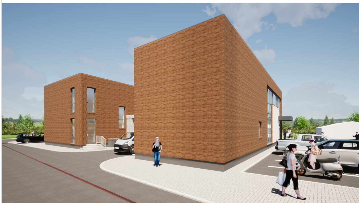
Vaizdas nuo pietinės pusės