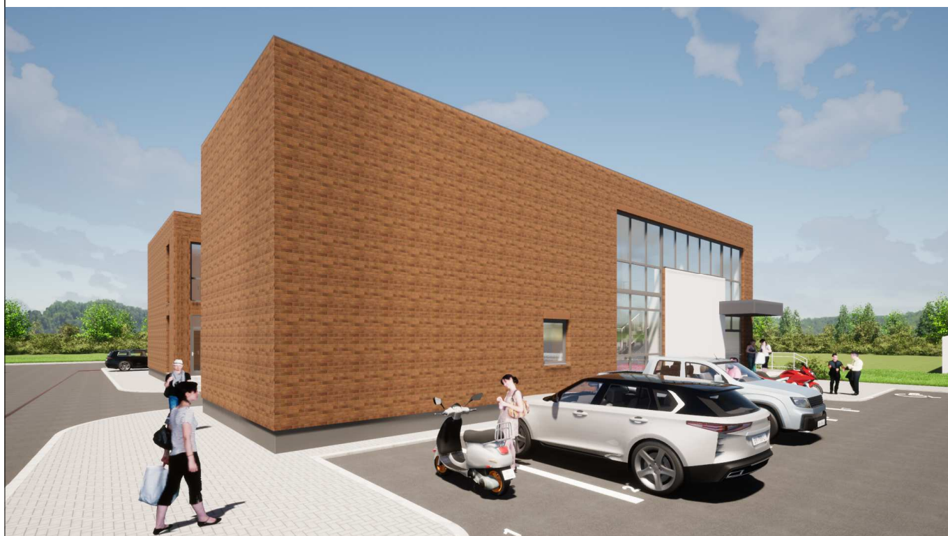
Vaizdas iš pietryčių pusės