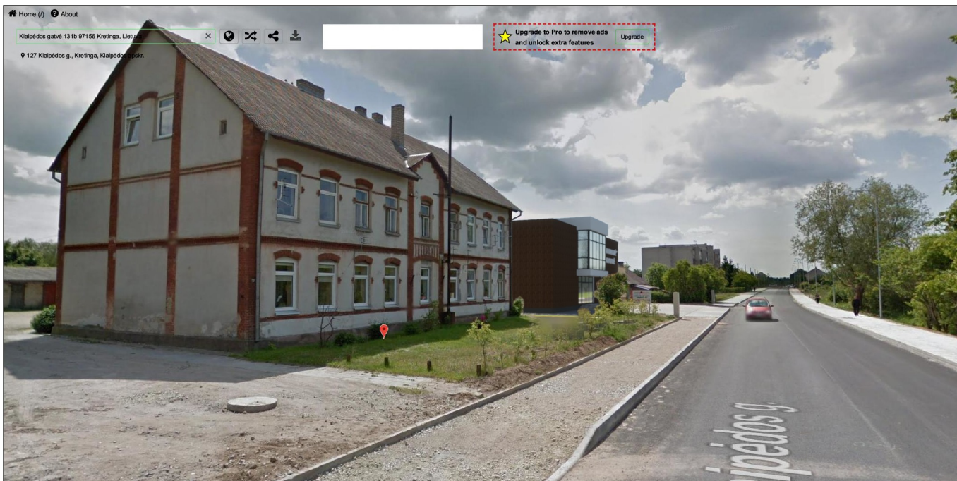
VAIZDAS NUO KLAIPĖDOS GATVĖS PIETŲ KRYPTIMI