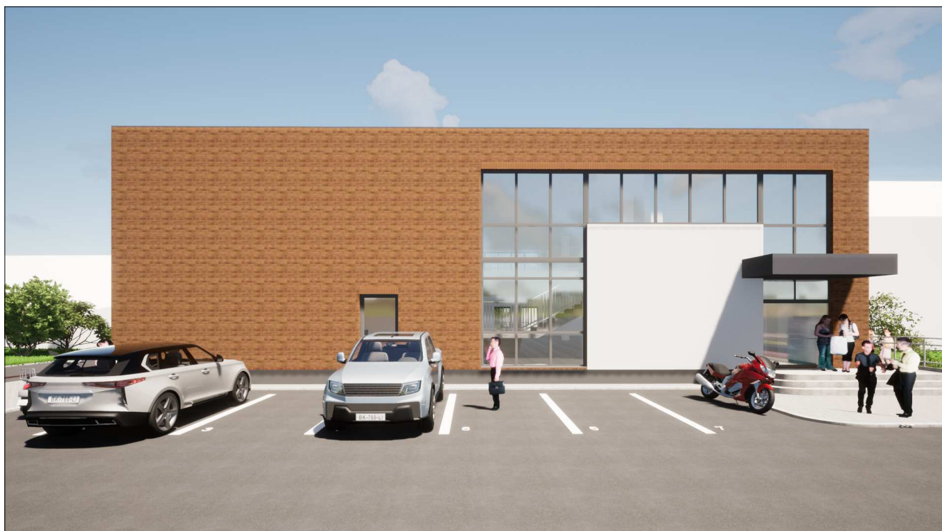
Fasadas tarp ašių 6-1. Vaizdas nuo kiemo pusės