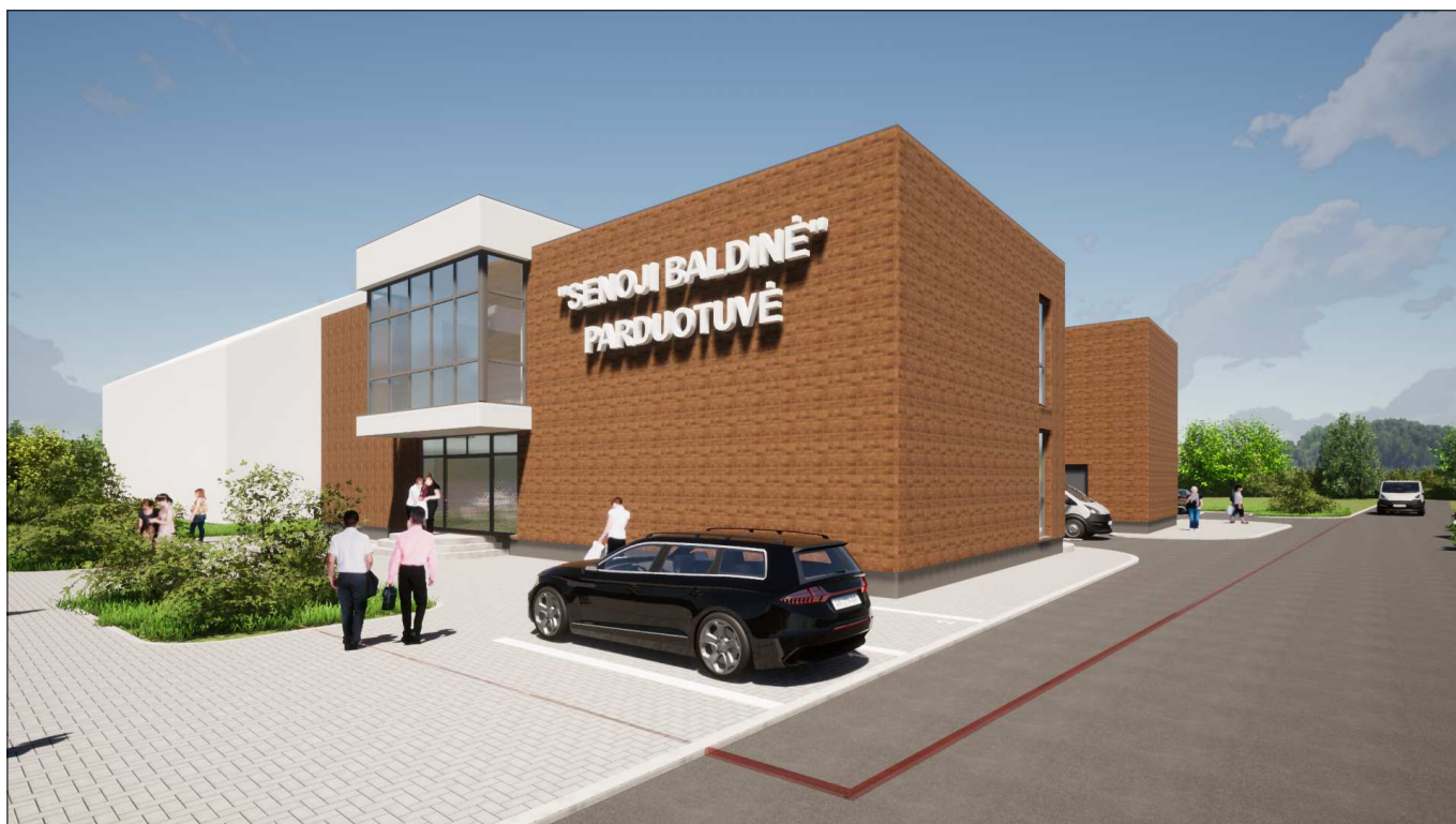
Vaizdas iš pietvakarių pusės