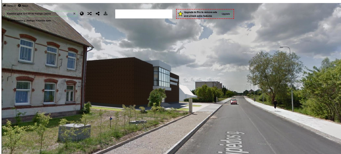
VAIZDAS NUO KLAIPĖDOS GATVĖS PIETŲ KRYPTIMI