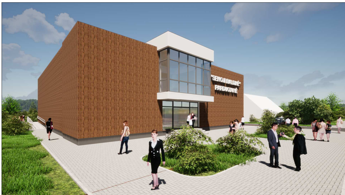
Vaizdas iš šiaurės vakarų pusės