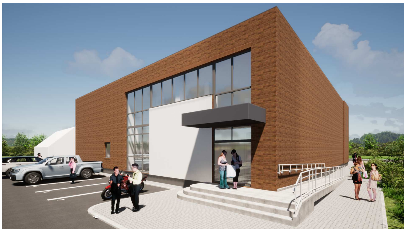
Vaizdas iš šiaurės rytų pusės