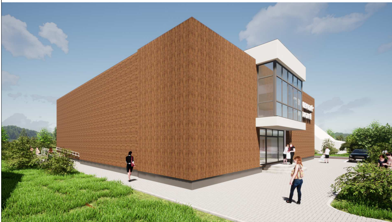
Vaizdas nuo šiaurinės pusės