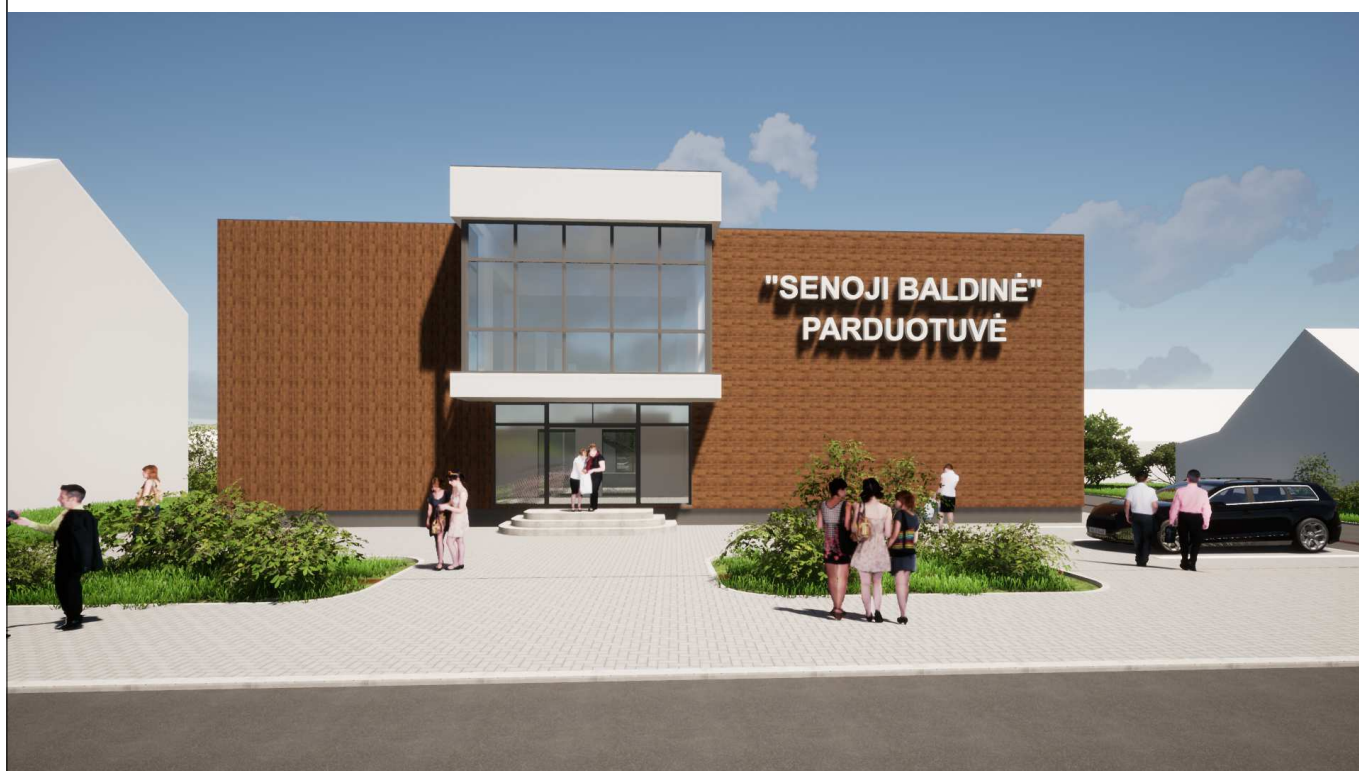
Fasadas tarp ašių 1-6. Vaizdas nuo Klaipėdos gatvės pusės