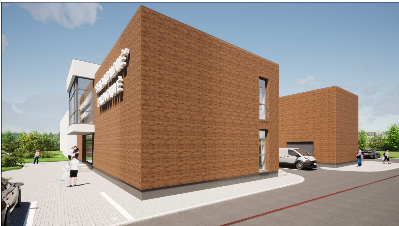
Vaizdas nuo pietvakarių pusės