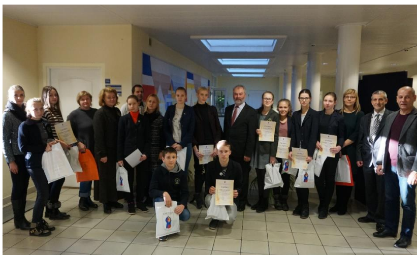
(Piešinių konkurso laureatai Antikorupcijos dienai pažymėti)

Antikorupcijos diena pažymėti Antikorupcijos komisija kartu su Švietimo skyriumi organizavo vaikų piešinių konkursą, kurio metu sulauktas 61 piešinys; vaikai įvairiomis technikomis atskleidė, kaip įsivaizduoja korupciją.