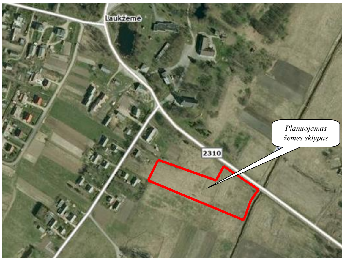
— Planuojamo sklypo riba

Planuojama teritorija: žemės sklypas, kurio kadastrinis numeris - Nr. 5647/0001:47 Laukžemės k.v., esantis Laukžemės k., Darbėnų sen., Kretingos r. sav. Planuojamos teritorijos plotas – 1,0153 ha. Žemės sklypas suformuotas atlikus tiksluosius kadastrinius matavimus.