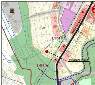
Bitauka iš Kretingos miesto bendrojo plano sprendinių, Urbanistinė struktūra, žemės tvarkymo ir kultūros paveldo brėžinys.