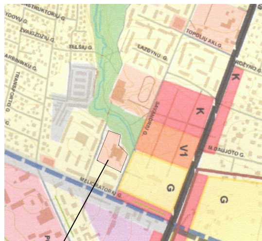
(2 pav.) Planuojamas sklypas Kretingosm.bendrojo plano ištraukoje