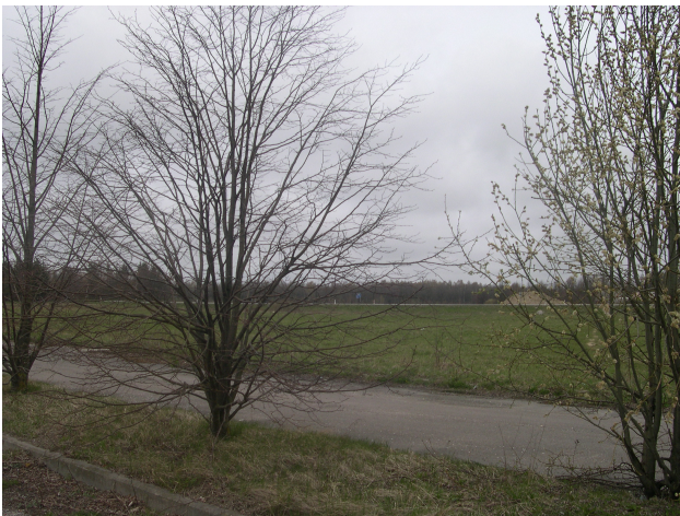
Bendras planuojamos teritorijos vaizdas.