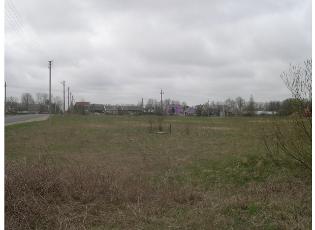
Bendras planuojamos teritorijos vaizdas.