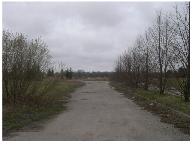
Bendras planuojamos teritorijos vaizdas.