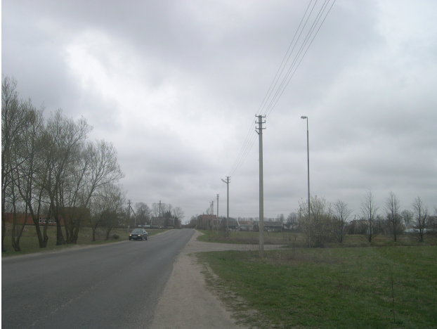
Bendras planuojamos teritorijos vaizdas.